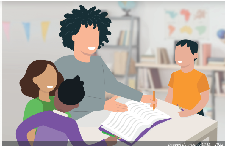
Imagen de archivo CME - 2022

Garantizar una educación inclusiva, equitativa y de calidad y promover oportunidades de aprendizaje durante toda la vida.